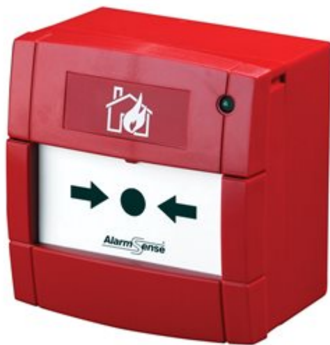
AlarmSense Manuelle melder. Teletec nr.115169