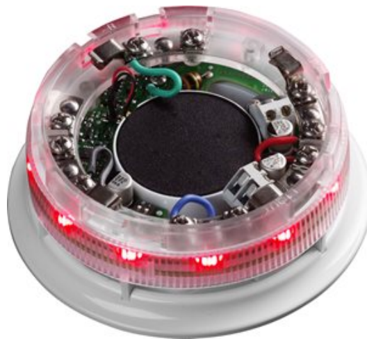
AlarmSense sokkelsiren med lys